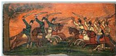
Panjska končnica, VOJAŠKI

Nariši Žanrski portretni motiv sebe (in svoje družine, če želiš), v času karantene . Risba naj bo kot skica za kasnejšo poslikavo, kjer bomo spoznali naslednjo nalogo, KOMPLEMENTARNI BARVNI KONTRAST . Tehniko slikanja boš lahko izbral/a sam/a (barvice, krede, voščenske, tempere, vodene barve). (lahko uporabite tudi A4 format-razen tisti, ki načrtujete slikanje z voščenkami, kredami ali tempero)