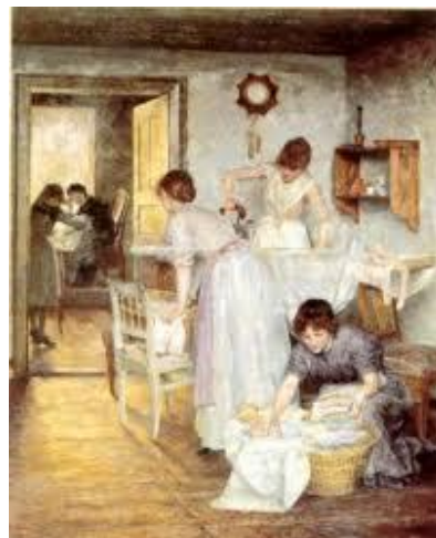
Ivana Kobilca, Likarice, MEŠČANSKI

Glede na poklicno dejavnost razlikujemo;