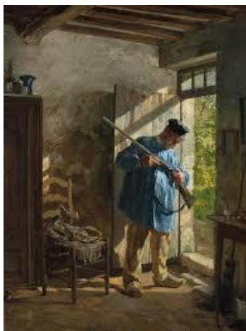
Jurij Šubic, Pred lovom, LOVSKI

Glede na poklicno dejavnost razlikujemo;